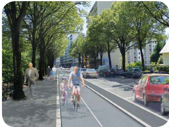
Travaux réalisés d'octobre à novembre