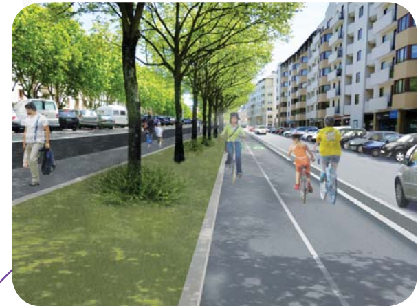
Travaux réalisés de juillet à septembre