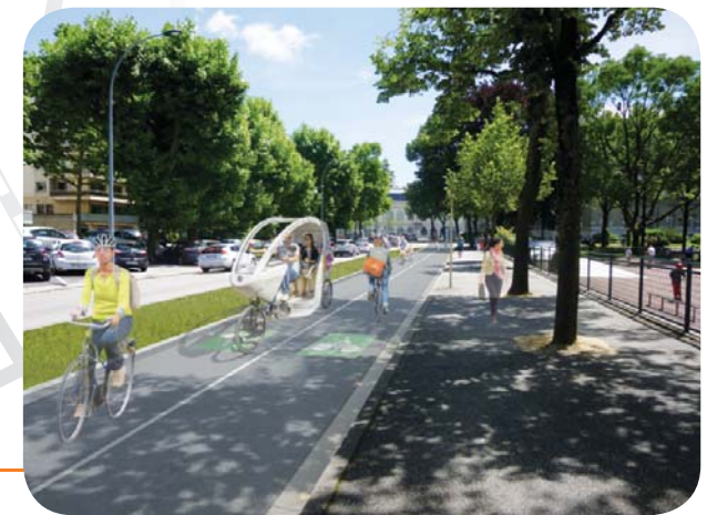
Travaux réalisés de septembre à octobre