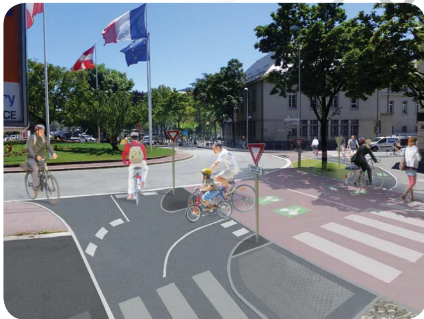
Travaux réalisés de juillet à août